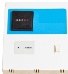
Coffret EcoStream 1

Le coffret électronique vous apporte confort d'utilisation et sécurité : décompteur horaire LCD (de 9000h à 0h), compteur journalier, alarme sonore et visuelle de défaut de lampe, mise en sécurité en cas de coupures électriques répétées.